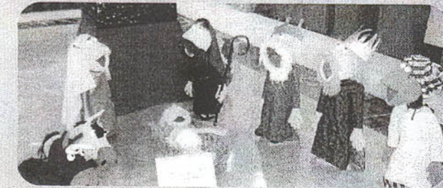
BELENES MUY ORIGINALES. Los materiales y las maneras de representar un Belén pueden ser muy variadas. Desde telas hasta gomaespuma, pasando por camisetas en las que se disponen los personajes del nacimiento.