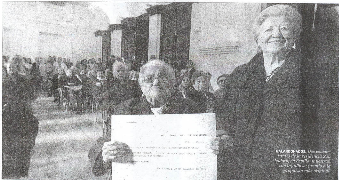
GALARDONADOS. Dos concursantes de la residencia San Isidoro, en Sevilla, muestran con orgullo su premio a la propuesta más original.

Jules Renard (1864-1910). Escritor y dramaturgo francés.